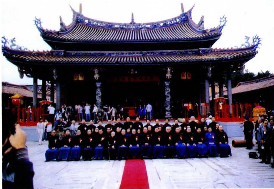
一之影合官獻體全、五十