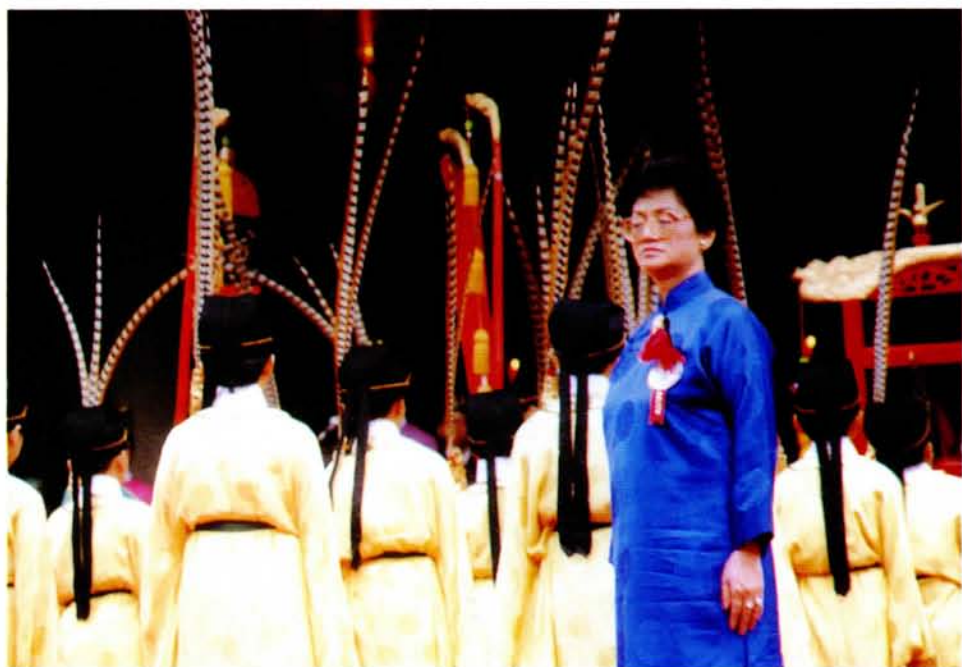
禮監行執（長局王）官儀糾、六