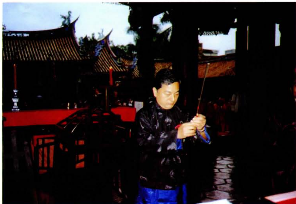
香上（長書秘黃）官獻分、五