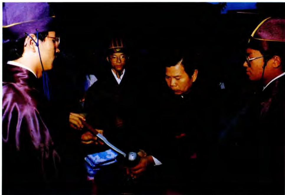
九、分獻官（毛院長）盥洗