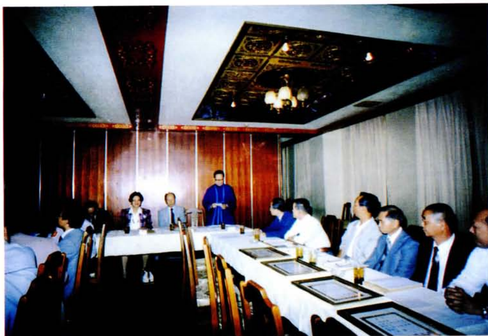
二之況實會討檢作工莫釋、八十