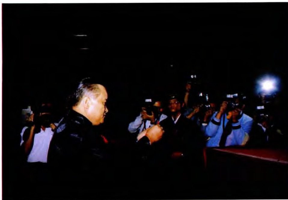
香上（長部許）表代統總、四