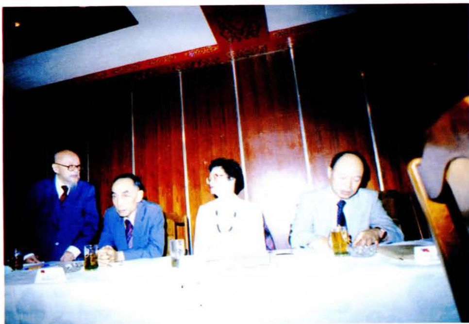
一之況實會討檢作工莫釋、七十