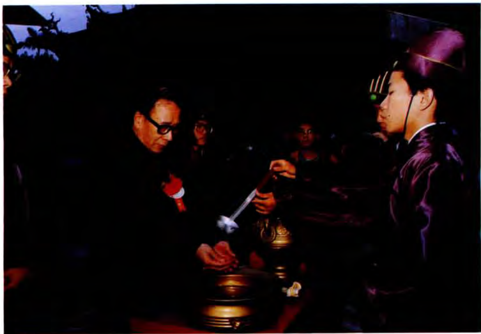
洗盥（長書秘副莊）官獻分、七