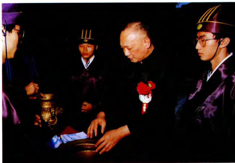
洗盥（長議表代員議楊）官獻分、八