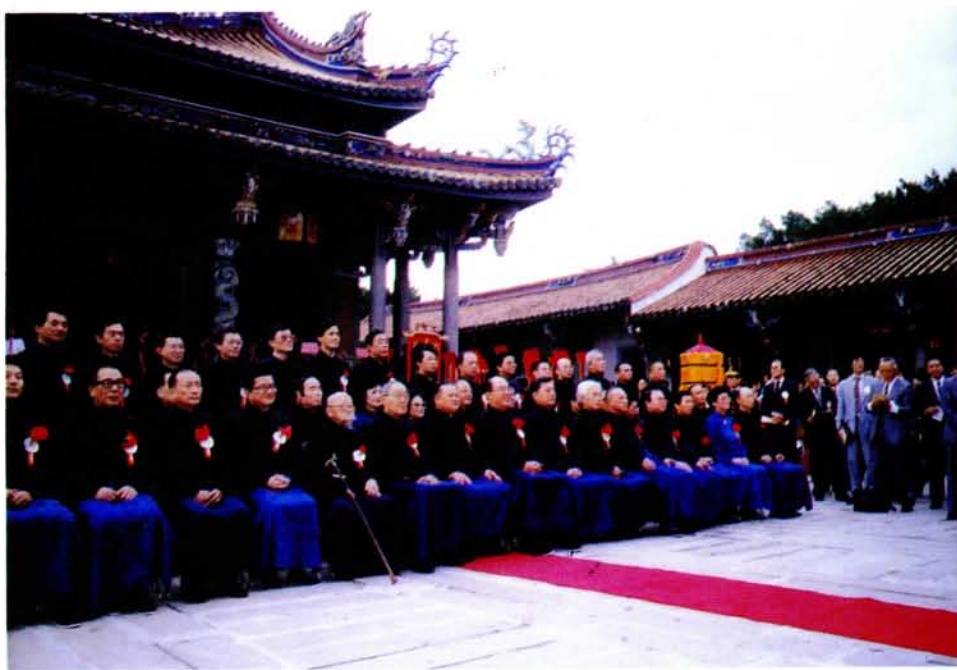
二之影合官獻體全、六十