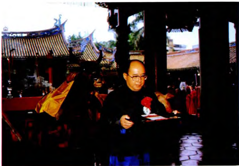
帛獻（長市吳）官獻正、三