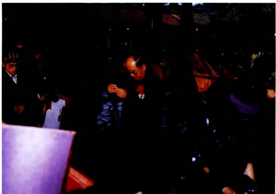
香上（長市吳）官獻正、二