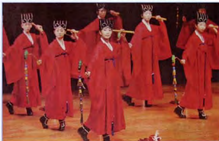
「世界的孔子：孔廟與祀典國際學術研討會」開幕式，昨天上午在台北市政府舉行，韓國「舞蹈為藝術」藝術團表演節目。