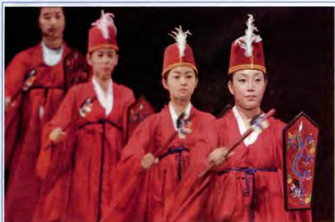
▲「世界的孔子：孔廟與祀典國際學術研討會」19日在台北市政府孔子劇場開幕，來自韓國的「舞蹈為藝術」帶來「孔子」舞蹈表演，演員們以柔和的動作來營造孔子教授「仁」的意境。