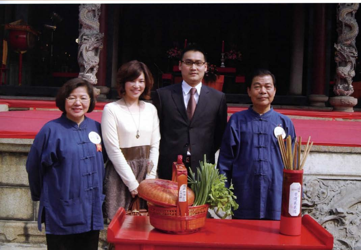
春祭典禮致贈智慧糕、孔夫紙、狀元筆、勵志書