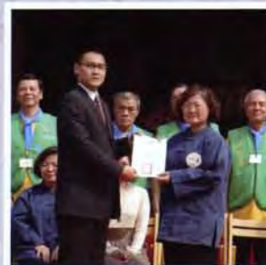
奉祀官孔垂長先生與大龍峒保安里里長暨志工合影