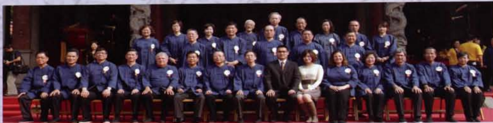
正獻官、奉祀官、分獻官、陪祭官合影