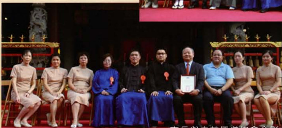
市長與中華儒道協會合影