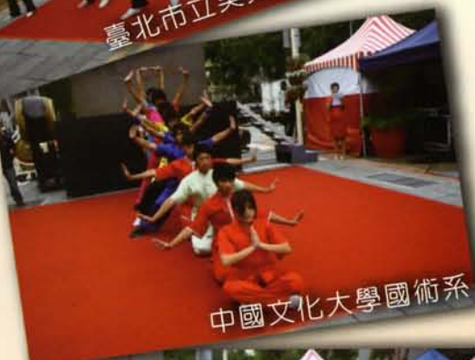
中國文化大學國術系