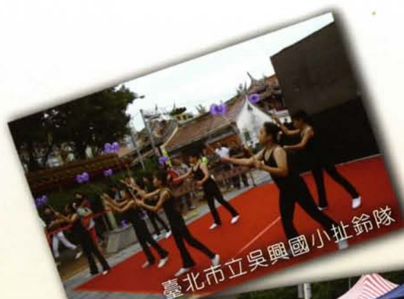
臺北市立吳興國小扯鈴隊