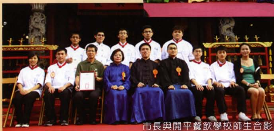
市長與開平餐飲學校師生合影