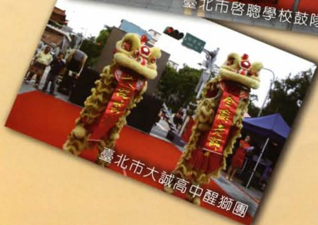
臺北市大誠高中醒獅團