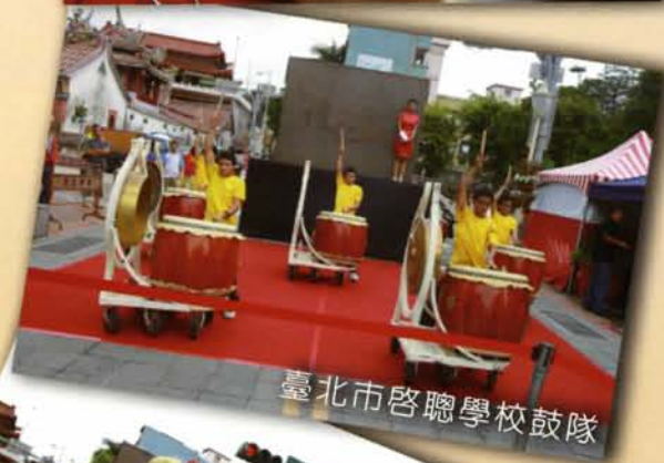
臺北市啟聰學校鼓隊