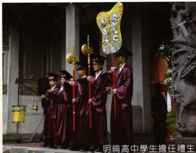
明倫高中學生擔任禮生