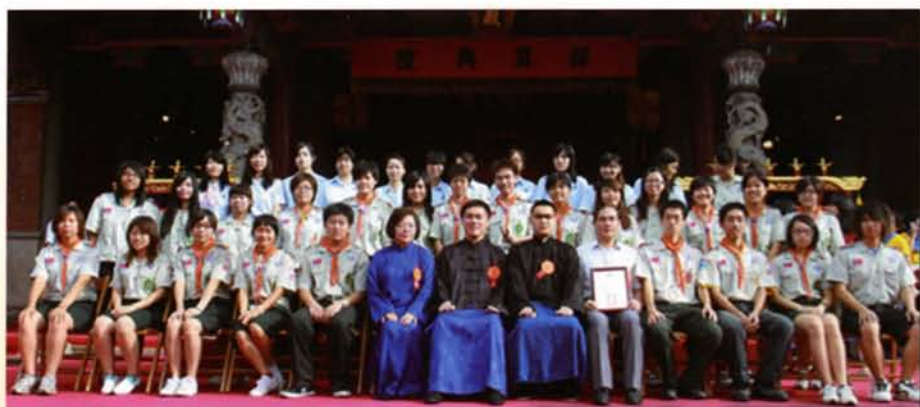
市長與師範大學童軍團合影