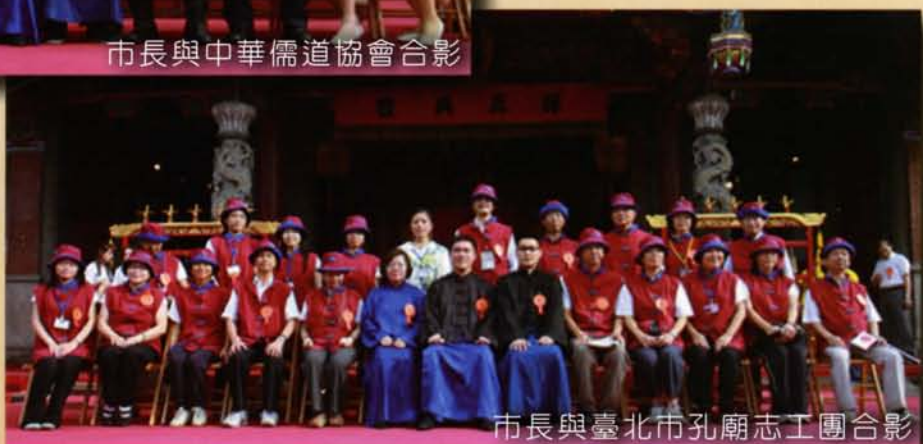
市長與臺北市孔廟志工團合影