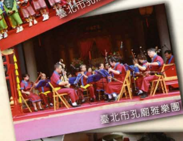
臺北市孔廟雅樂團