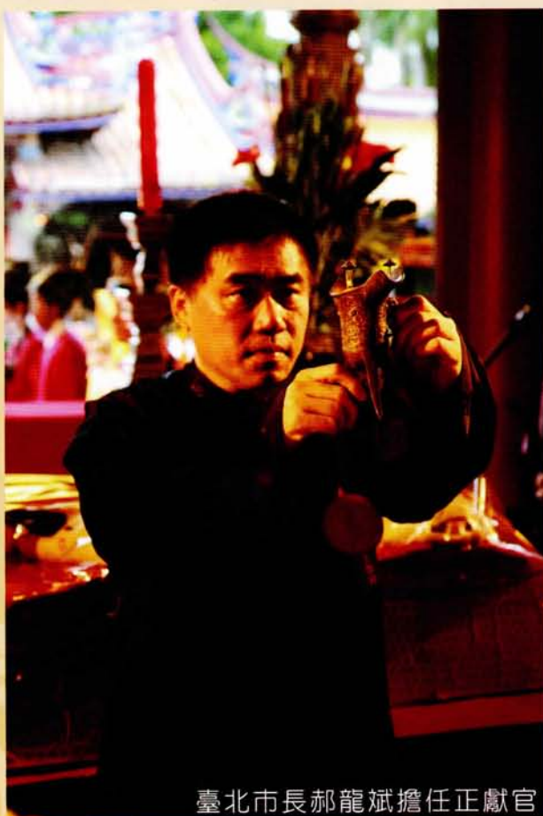
臺北市長郝龍斌擔任正獻官