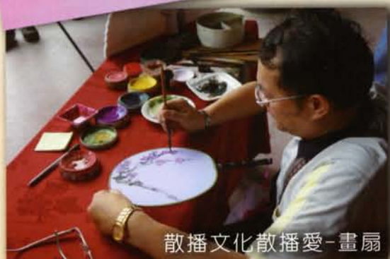
散播文化散播愛-畫扇