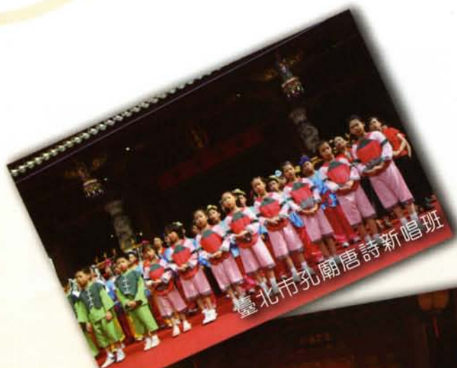
臺北市孔廟唐詩新唱班