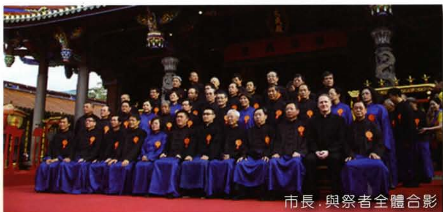
市長與祭者全體合影