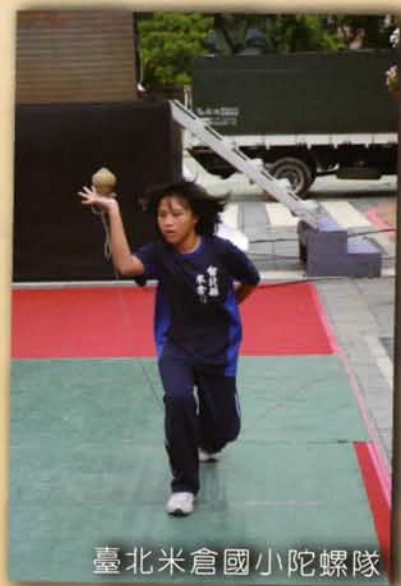
臺北米倉國小陀螺隊