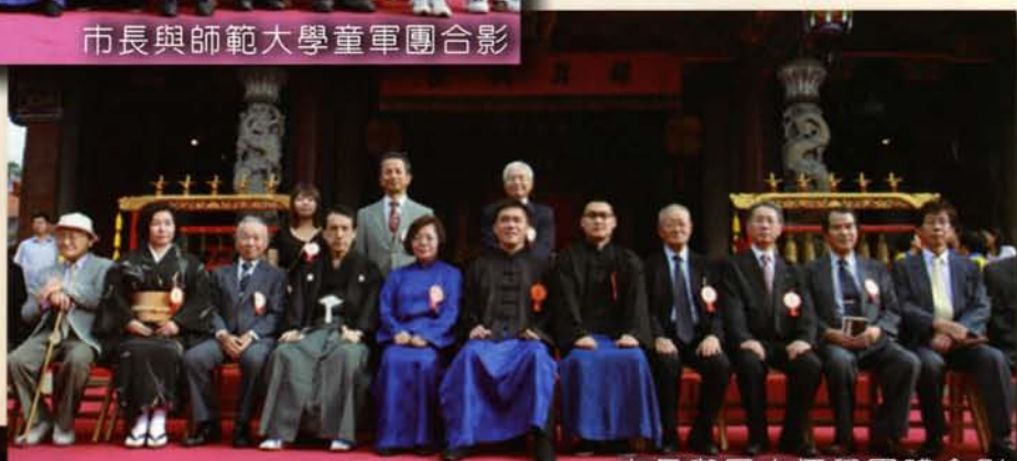
市長與日本儒學團體合影