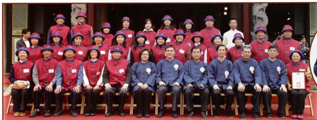
郝市長與文化志工合影