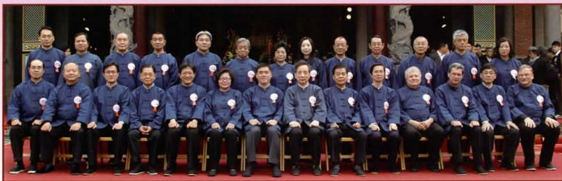
郝市長與分獻官、陪祭官合影