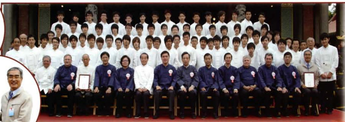
郝市長與禮生合影