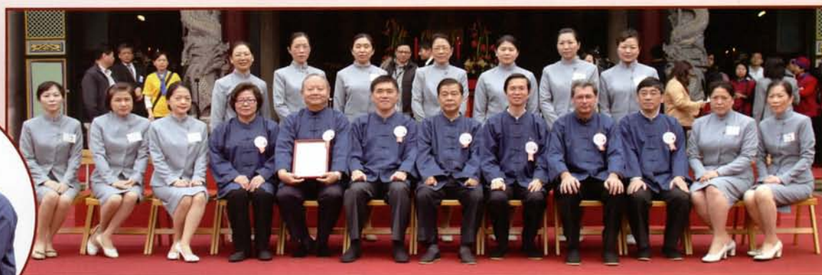
郝市長與中華儒道研究協會合影