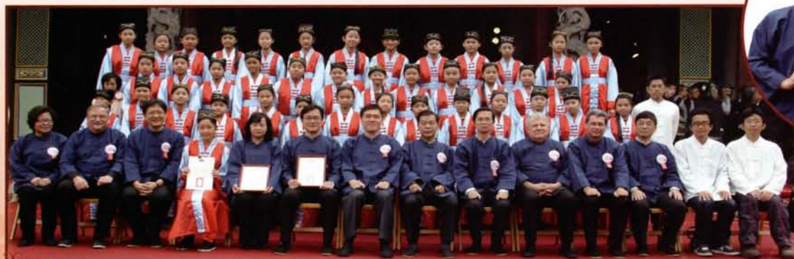
郝市長與僮生合影