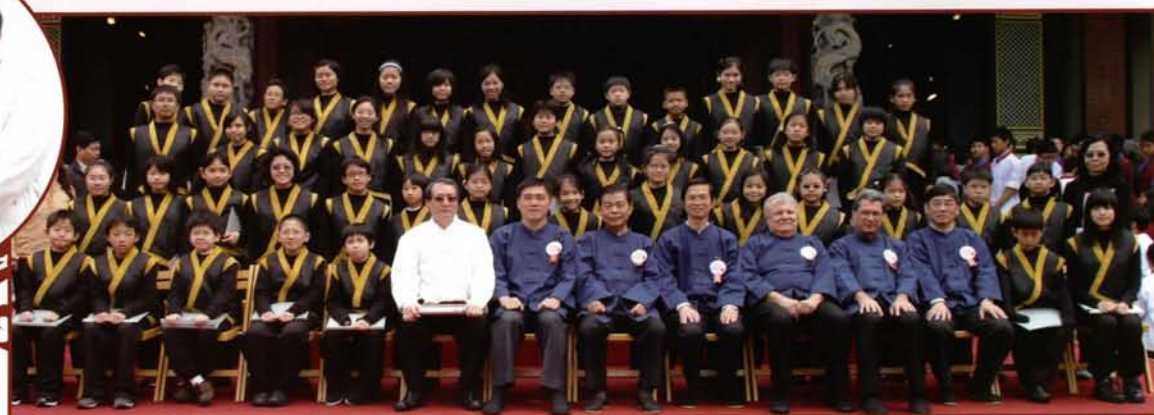
郝市長與歌生合影