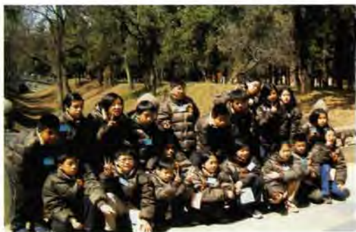
▲禦寒實用羽絨外套

(四) 訂2月21日晚上7：00於孔廟明倫堂開僑生家長說明會，將行程內容及學生須知，與家長溝通說明。