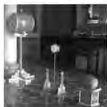
應鼓（左） 鼗鼓（中） 搏拊（右）