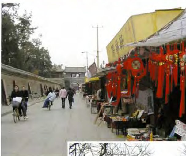
▲ 紀念品及印章 石刻店街