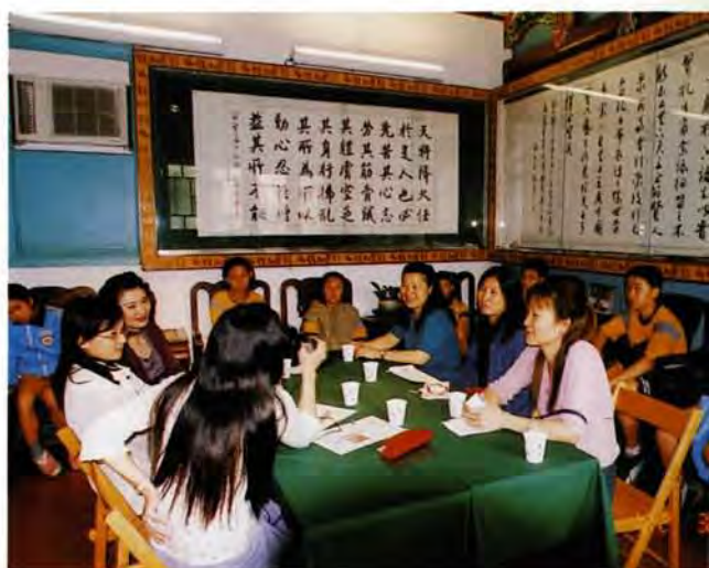
▲家長及侑生接受媒體訪問