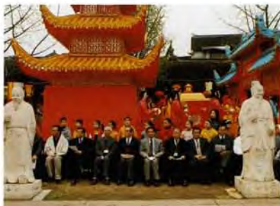
大成殿前廣場花燈