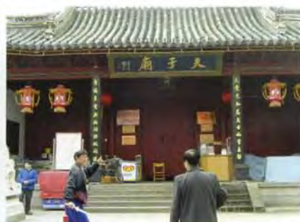
夫子廟大門前早起運動的民衆