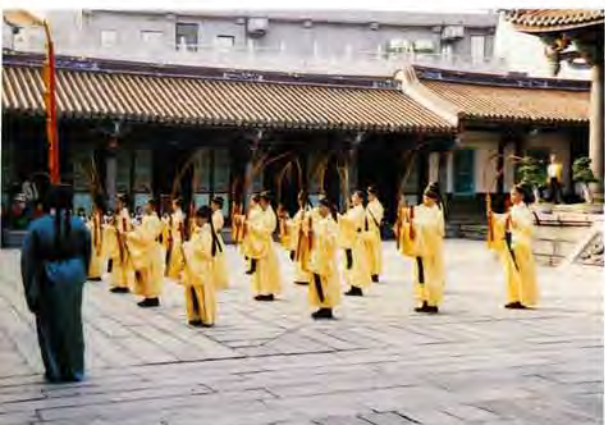
▲辛勤的演練（於孔廟大成殿前廣場）