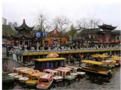
週邊仿古建築商街