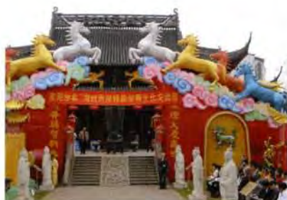
大成殿及殿前花燈