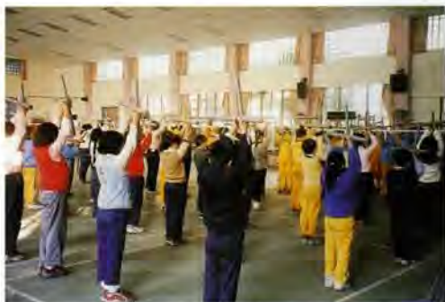
▲行前演練（於大龍國小大禮堂）