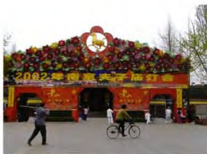
櫺星門上飾滿慶祝元宵的花飾